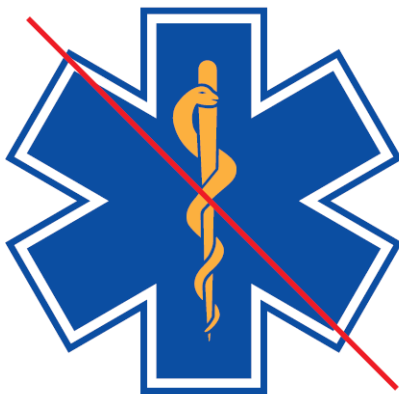
Keine zusätzlichen Farben

Das Logo «Star of Life» ist in seinen Originalfarben zu verwenden. Veränderungen in der grafischen Gewichtung und Orientierung sind zu unterlassen, wie auch Kombinationen mit ergänzenden Logos oder Schriftzügen sind zu vermeiden.