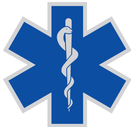
Star of Life Typ B