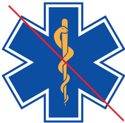
Aucune couleur supplémentaire

Le logo «Star of Life» doit être utilisé dans ses couleurs originales. Il faut s'abstenir de toute modification dans sa pondération et orientation graphiques, de même qu'il faut éviter des combinaisons avec des logos complémentaires ou autres.