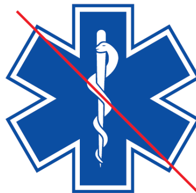
Pas d'utilisation en miroir